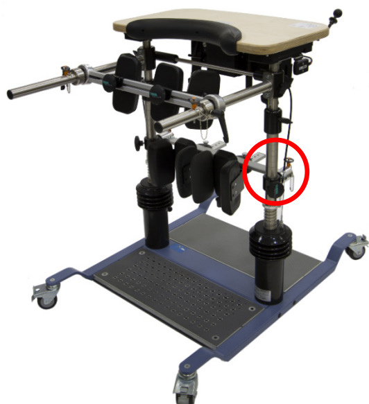
Ilustración: THERA-Trainer balo

El tornillo hexagonal de fijación para la suspensión del apoyo para las rodillas está roto.