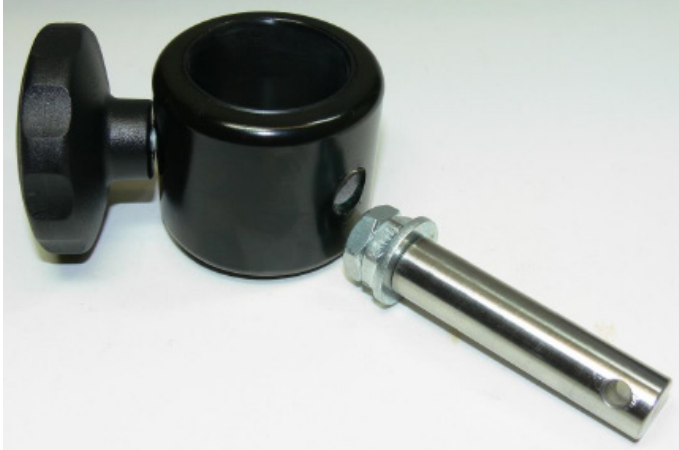
Ilustración: tornillo hexagonal de fijación roto

Se ha detectado como causa la fragilidad del tornillo hexagonal galvanizado de resistencia \geq 10,9 producida por absorción de hidrógeno. Esta fragilidad por absorción de hidrógeno puede producirse de manera irregular. La rotura puede ocurrir incluso al aplicar cargas poco pesadas. Si el tornillo hexagonal de fijación se rompe, el apoyo para las rodillas puede desprenderse de un lado y provocar inestabilidad en el paciente al ponerse de pie o durante los ejercicios terapéuticos.