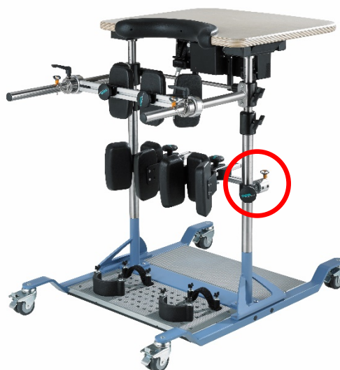
Ilustración: THERA-Trainer verto