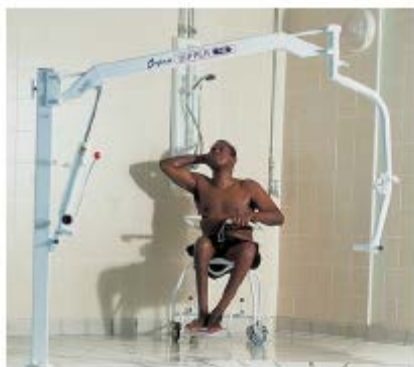
Oxford Dipper (Nº pza. OP10013)

Elevadores para piscinas Oxford Dipper, modelos OP10013 y OP10014 fabricados por Joerns Healthcare Ltd. Reino Unido.