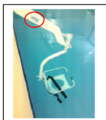
Ubicación de etiqueta

Localización de la etiqueta que incluye la fecha de fabricación del elevador