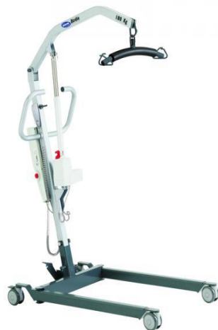
Fig 1. Grúa Invacare Birdie

Grúa de elevación Invacare Birdie, fabricada por Invacare Portugal, Lda, Portugal.