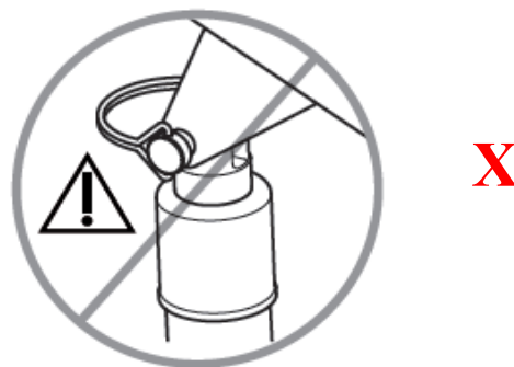
Fig. 4. Posición incorrecta del D-Clip