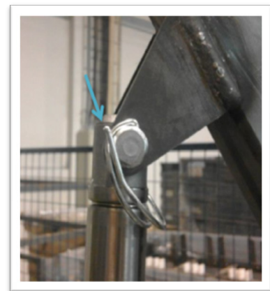
Fig 2. Imagen del D-Clip