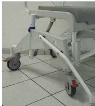
Dispositivo anti-vuelco (código 1535936)