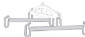
SideBar™ Standard # 3156011