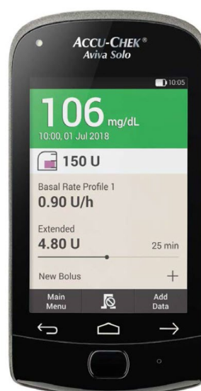
Accu-Chek Aviva Solo