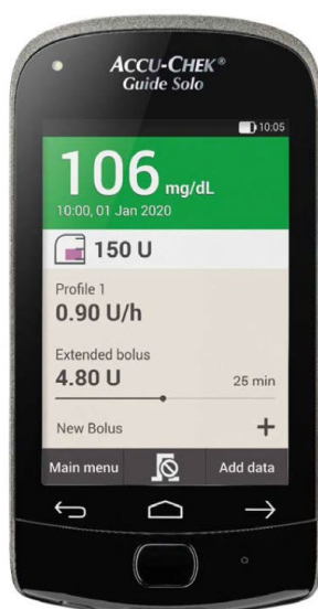
Accu-Chek Guide Solo