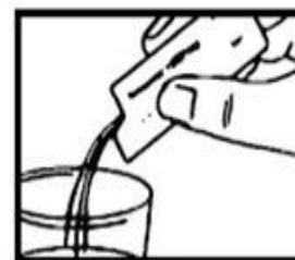
4. Disolverlo en medio vaso de agua (120ml) y bebérselo