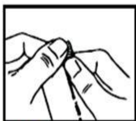
2. Con la otra mano rasgue el sobre por donde indican las flechas