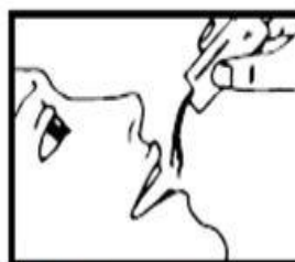
3. Puede tomarlo directamente desde el sobre o