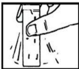
1. Sujetar firmemente el sobre de Citicolina Apotex 1000 mg por el extremo y agitar

La dosis normal es de 1 a 2 sobres al día, en función de la gravedad de su enfermedad. Puede tomarse directamente o disuelta en medio vaso de agua (120 ml) con las comidas o fuera de ellas.